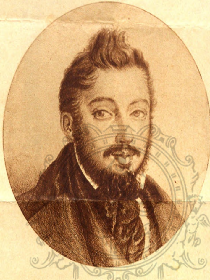
MARIANO JOSE DE LARRA

Es una octavilla de papel de hilo ahuesado, que tiene en el ángulo superior de la izquierda un anagrama en relieve, sin color, con sus tres iniciales, M. J. L. (Este sello consta, por cierto, en el inventario que a su muerte se hizo, y aparece reseñado junto a tres navajas de afeitur y algo que tiene un fino encanto de sugerencia, una honda melancolía: "cubierto pequeño, de plata, que usaba la niña".)