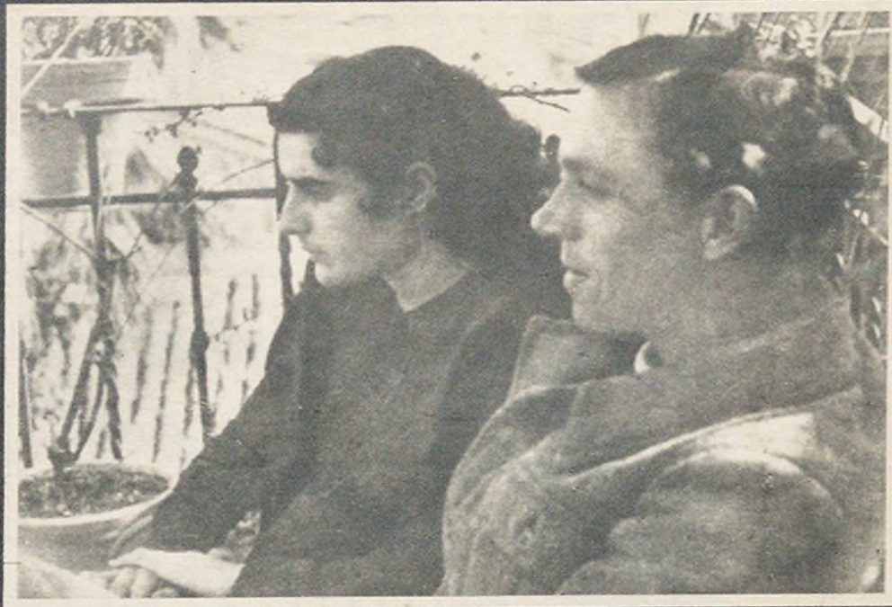
Sobre estas líneas, Miguel Hernández junto a su esposa, Josefina Manresa, en una fotografía de 1937. Abajo, una escena de "El labrador de más aire", del poeta de Orihuela.