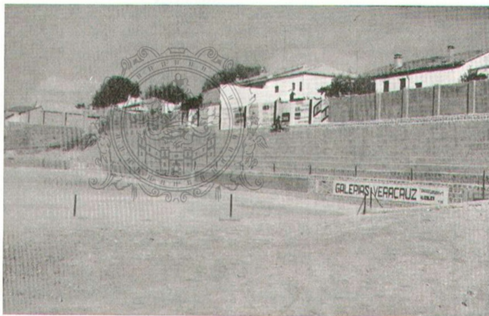
Del C. de F. Villacarrillo. Nuevas instalaciones Campo Vera Cruz.