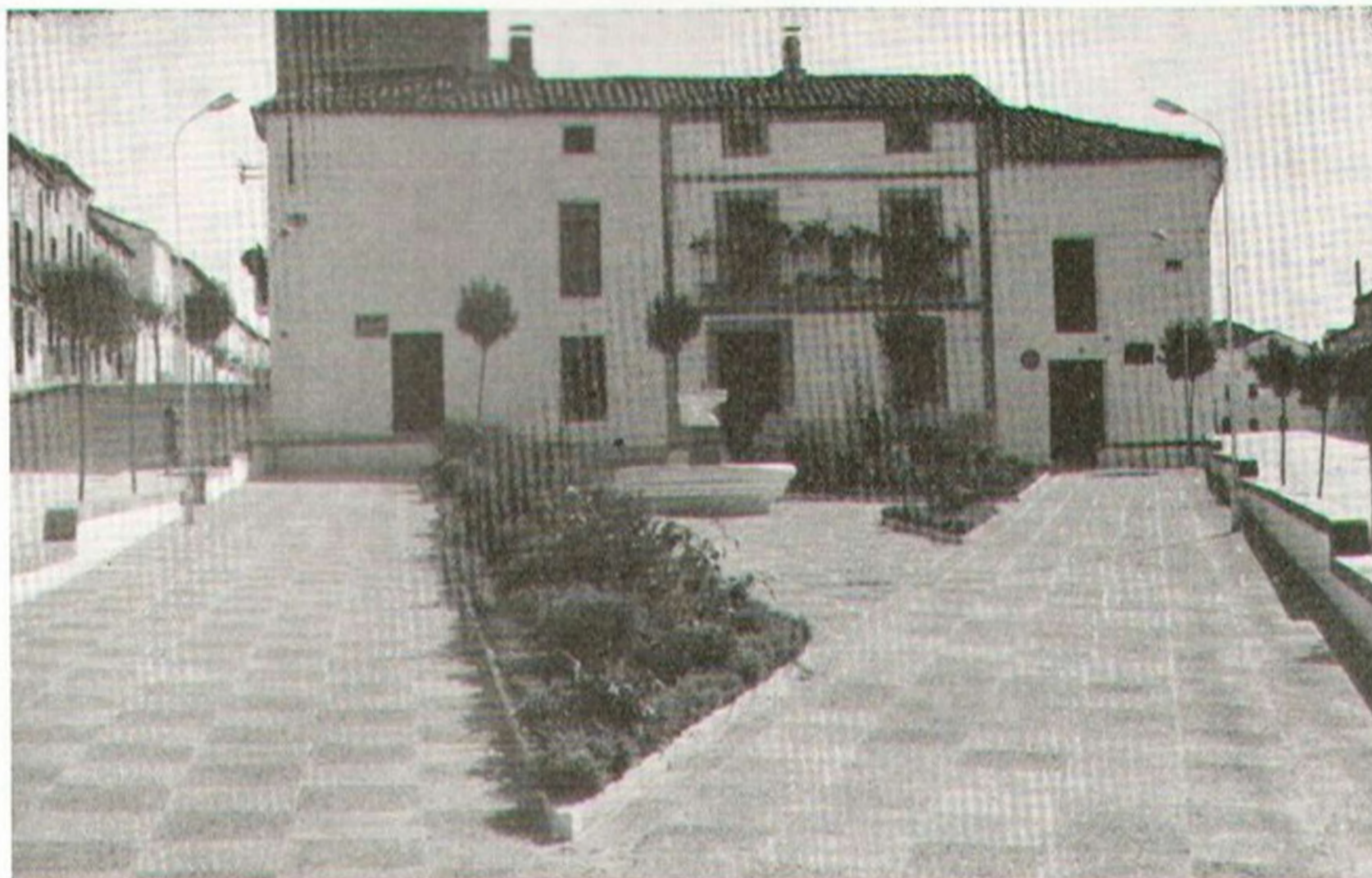
De iniciativa municipal. Plaza de San Lucas