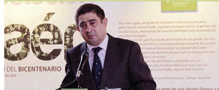
El presidente, junto a otros miembros de la Corporación y autoridades provinciales, en el acto de inauguración

REYES resaltó que con esta exposición, la Administración provincial "abre la Diputación, la casa de todos los jiennenses, ubicada en uno de los edificios más importantes de la arquitectura civil jiennense que alberga con la configuración actual las oficinas de la Diputación desde el día 18 de junio de 1890".