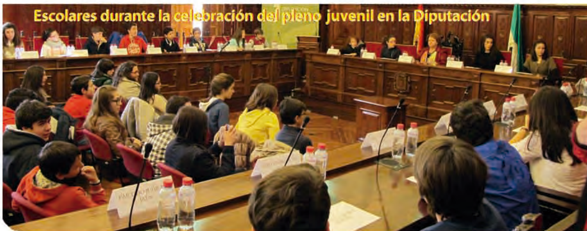
Escolares durante la celebración del pleno juvenil en la Diputación

VISITAS. También fueron muchos los escolares jiennenses que visitaron la exposición 'Diputación es Jaén' en el Palacio provincial y tuvieron la oportunidad de conocer los "entresijos" de la Administración provincial. El presidente de la Diputación, Francisco Reyes, recibió a algunos de ellos en el Salón de Plenos y les explicó cómo se configura la Corporación, así como las principales funciones de la Administración provincial en su servicio a los 97 ayuntamientos y a los ciudadanos.