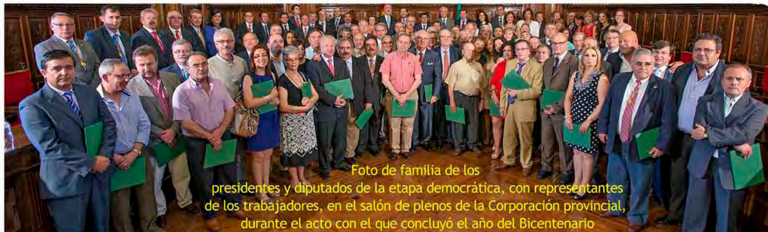
Foto de familia de los presidentes y diputados de la etapa democrática, con representantes de los trabajadores, en el salón de plenos de la Corporación provincial, durante el acto con el que concluyó el año del Bicentenario

Reyes: "Es justo celebrar el Día del Bicentenario con un homenaje a los diputados y diputadas de la época democrática y cómo no, a los trabajadores y trabajadoras de esta casa, que son el pilar en el que se apoya la Administración provincial para funcionar y llevar a cabo sus objetivos".