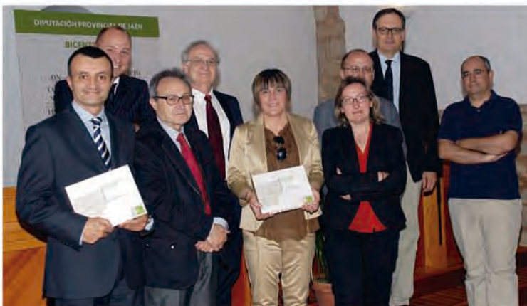
Los autores del monográfico 'Modelos históricos de diputaciones provinciales', en la presentación