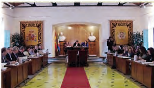
Linares acogió el primero de los plenos fuera del Palacio Provincial