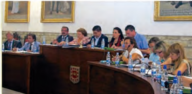
Imagen de la sesión que tuvo lugar en Úbeda