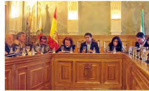
Momento del pleno de la Diputación celebrado en la localidad de Bailén