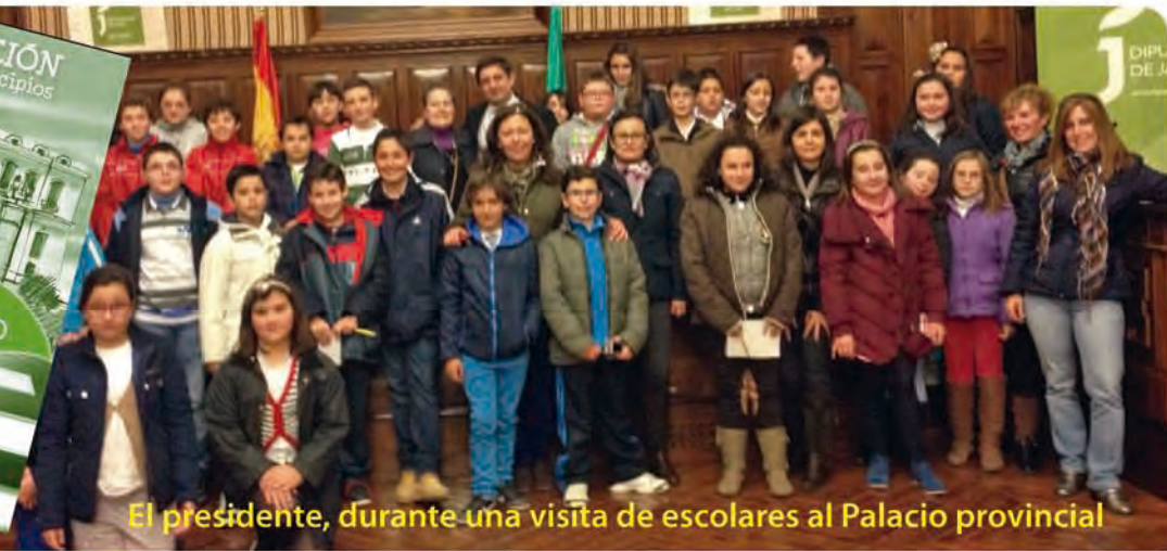
El presidente, durante una visita de escolares al Palacio provincial

El programa de actividades del Bicentenario de la Diputación de Jaén contempló una serie de acciones dirigidas especialmente a los escolares de la provincia, entre las que estuvieron la edición de un cuadernillo didáctico, un pleno juvenil y un concurso de redacción, que sirvieron para mostrar la labor de la Administración provincial entre el alumnado de los municipios jiennenses.