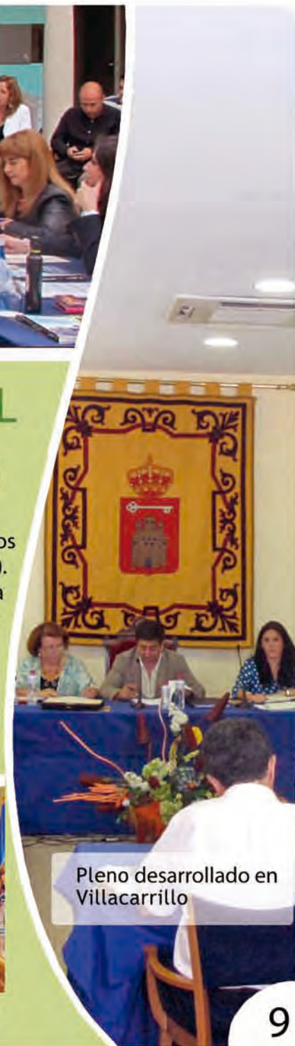
Pleno desarrollado en Villacarrillo