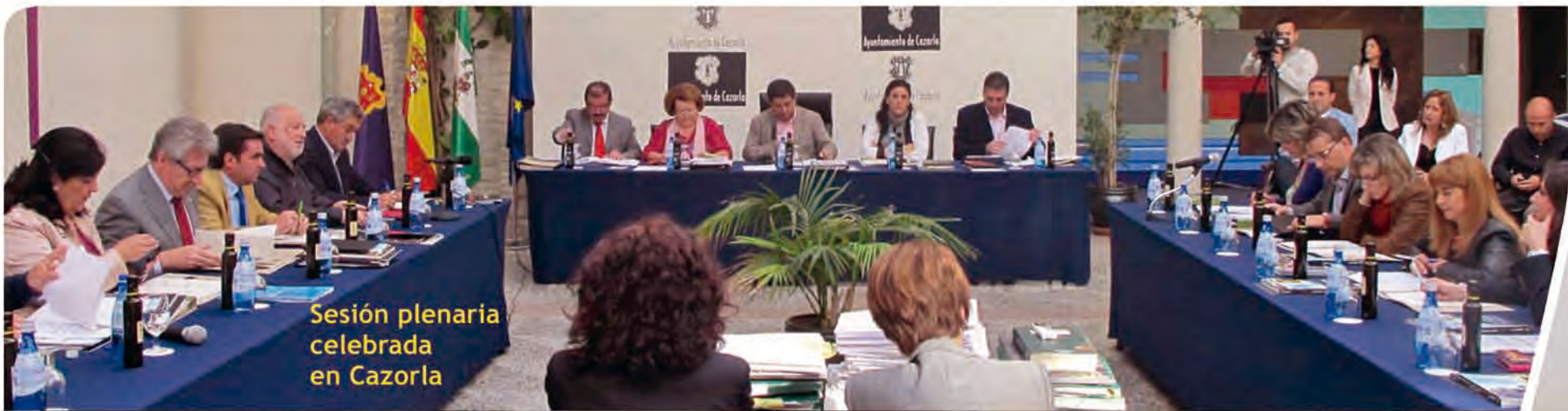
Sesión plenaria celebrada en Cazorla