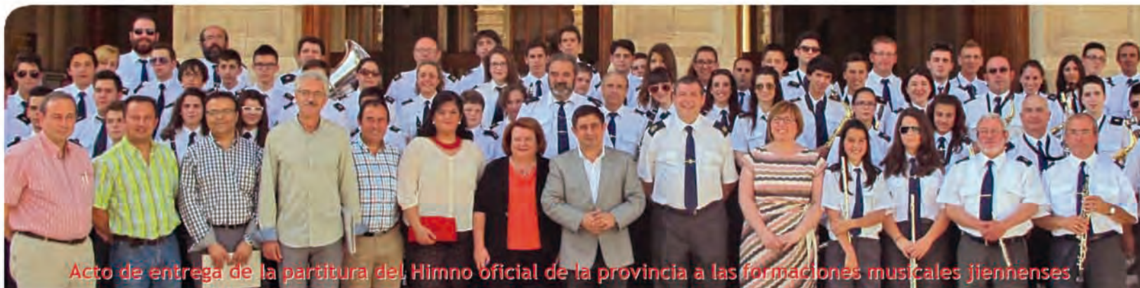
Acto de entrega de la partitura del Himno oficial de la provincia a las formaciones musicales jiennenses