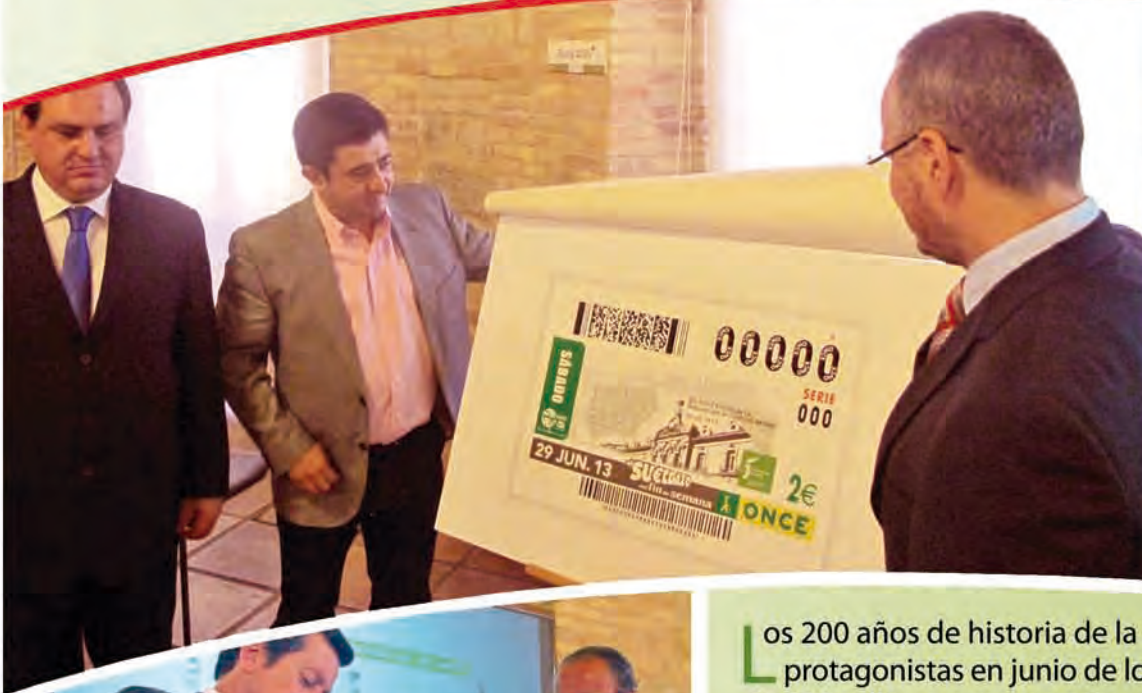
El presidente Francisco Reyes presentó el cupón de la ONCE y el décimo de la Lotería Nacional alusivos al Bicentenario

SELLO. Correos emitió 400 sellos conmemorativos del Bicentenario, una pieza de coleccionista que se puso a disposición de todos los interesados en el Palacio Provincial y que se agotó en apenas una hora. La vicepresidenta de la Administración provincial, Pilar Parra, aseguró que "sello, sobre y matasellos se convertirán en notarios de esta conmemoración, para deleite de coleccionistas y amantes de la filatelia". El diseño del sello mostró la fachada principal del Palacio Provincial con la denominación de la Diputación Provincial de Jaén y la marca del Bicentenario 1813-2013.