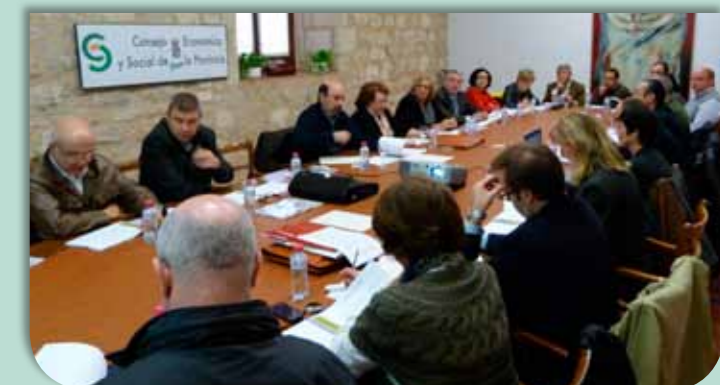
Pleno extraordinario del CES provincial del 21 de noviembre de 2012

En cuanto a las Comisiones de Trabajo, fundamentalmente se han reunido para elaborar los distintos capítulos que componen la Memoria sobre la situación socioeconómica y laboral de la provincia de Jaén 2011, excepto la Comisión de Servicios Sociales, Salud y Consumo, que se ha reunido en más ocasiones para la elaboración del "Dictamen Análisis de la aplicación de la Ley 39/2006, 14 de diciembre, de promoción de la autonomía personal y atención a las personas en situación de dependencia en la provincia de Jaén" y la Comisión de Economía que además elaboró la propuesta de "Dictamen sobre la Evolución socioeconómica y laboral de la provincia de Jaén 2005-2011" y del "Dictamen sobre los presupuestos de la Diputación 2013".