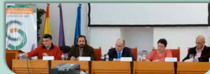
Ponentes de la Mesa Redonda titulada "Desarrollo Rural y Economía Sostenible".