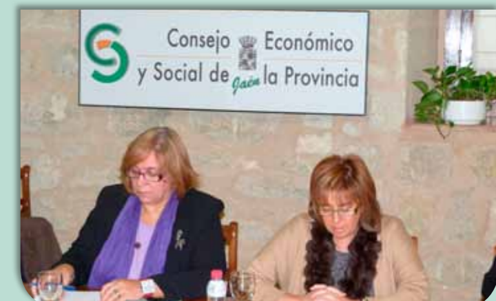
Pleno extraordinario del CES provincial del 22 de noviembre de 2012