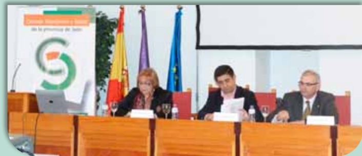
Ponentes en la inauguración de las Jornadas sobre la situación socioeconómica y laboral de la provincia de Jaén

Como todos los años, el Consejo Económico y Social de la provincia de Jaén en colaboración de la Universidad de Jaén organizó el pasado 21 de diciembre, las Jornadas sobre la situación socioeconómica y laboral de la provincia, que sirvieron de foro para profundizar y discutir sobre temas de interés para la misma; en esta ocasión se pretendió analizar, entre otros temas, la Política Agraria Común a partir del año 2014 y su incidencia en la provincia de Jaén y el Desarrollo Rural y la Economía Sostenible.