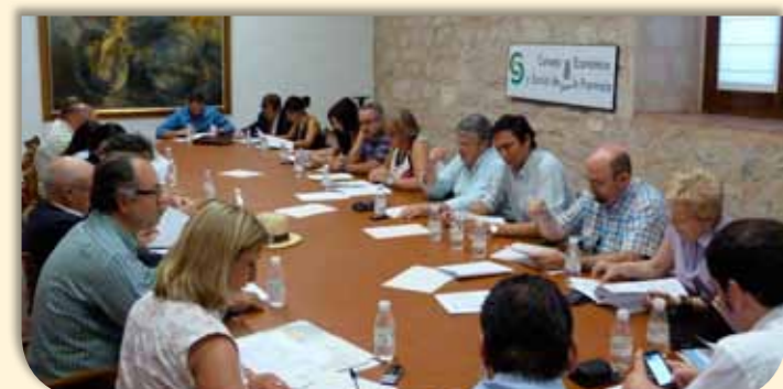
Pleno del CES provincial del día 10 de julio de 2012

Igualmente en el Pleno del CES del día 10 de julio se aprobó la modificación puntual del Reglamento de Organización y Funcionamiento Interno vigente.