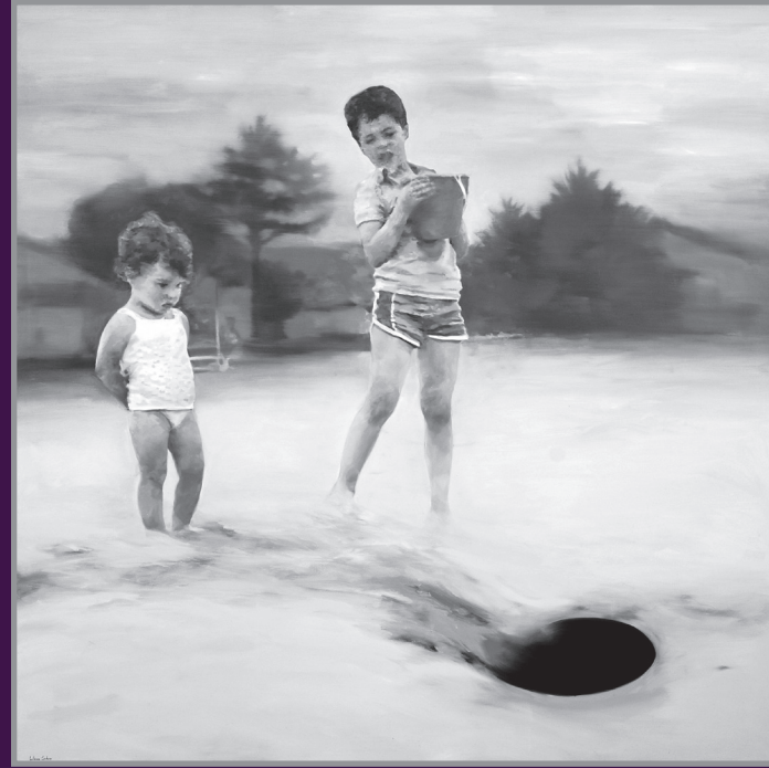
Primer Premio Guillermo Sedano Vivanco «El Agujero» 195 x 195 Óleo s/lienzo 2012