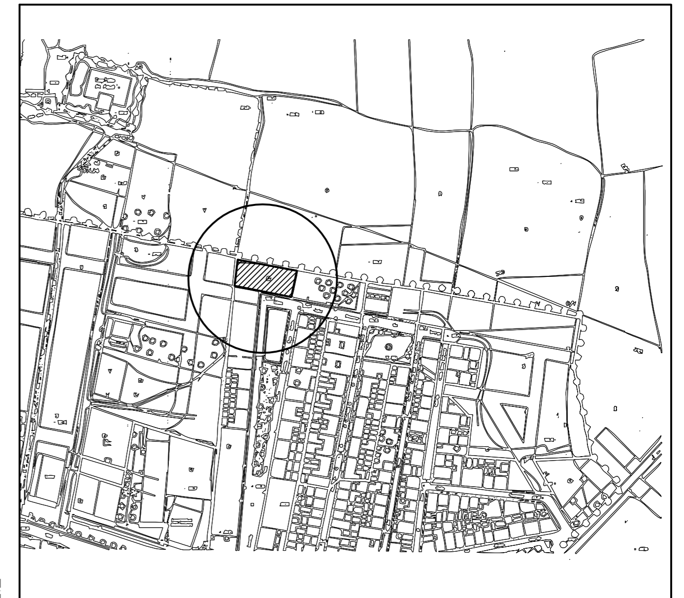
PLANO DE SITUACION Escala 1:2.000

C/ JULIO ROMERO DE TORRES, S/Nº SOLAR ACOTADO Escala 1:150 / Cotas en cms.