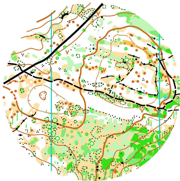
Ejemplo de terreno

ATENCIÓN: los recorridos atraviesan una carretera muy poco transitada, pero hay que tomar la máxima precaución al cruzarla o al utilizarla como tramo