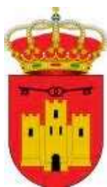
Ayuntamiento Santisteban del Puerto