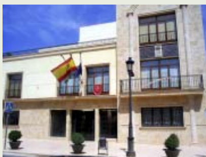
Ayuntamiento de Arroyo del Ojanco