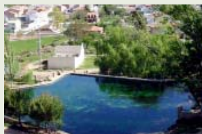
Nacimiento del río Arbuniel