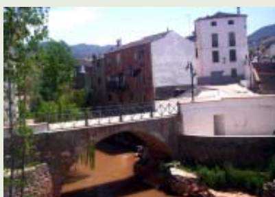
Puente de Génave